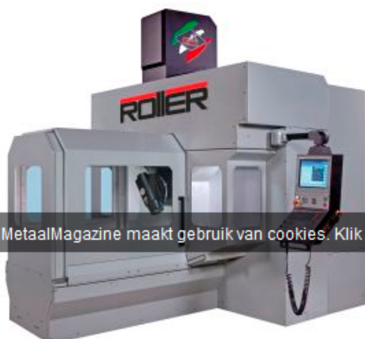
De HSC-portaalfreesmachine Roller van Parpas