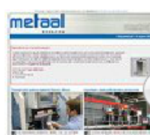
Nieuwsbrief Metaal Magazine