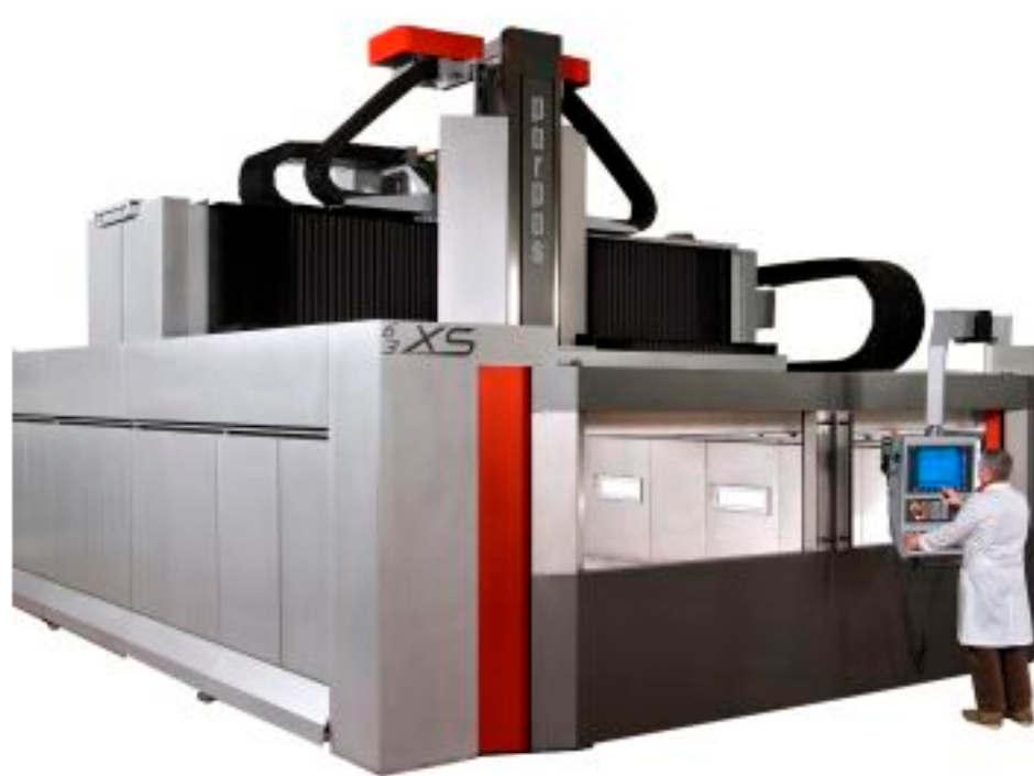
De gantry-freemachine XS van Gruppo Parpas heeft een bereik tot 30 m in de X