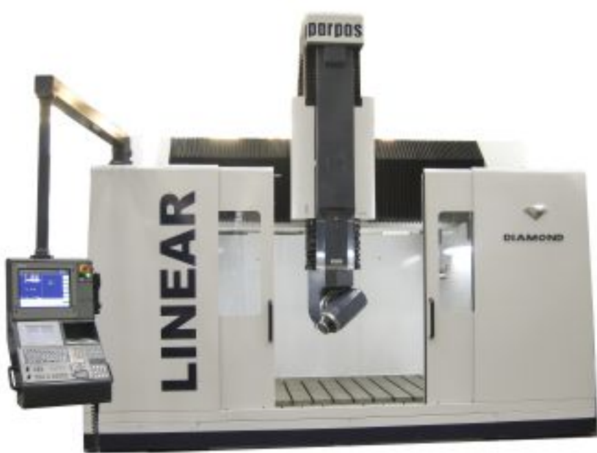
De hogesnelheidsfreesmachine Diamond van Parpas is eveneens voorzien van aandrijvingen met lineaire motoren